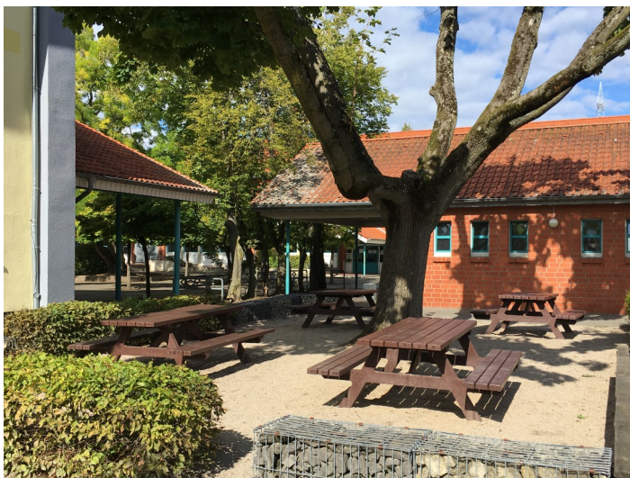
Unsere neuen Sitzmöglichkeiten auf dem Schulhof aus Recyclingkunststoff